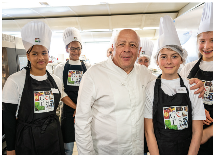
Thierry Marx et les candidats du concours Gastro'Mômes.